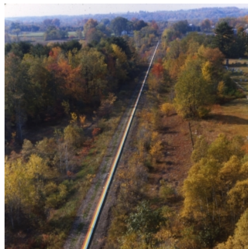
Patricia Johanson. Stephen Long , 1968; Buskirk, NY; paint on plywood, 48768 x 5 x 1,2 cm; photo courtesy of the artist.

Al in 1969 ontwikkelde de kunstenaar een visionair, samenhangend ecologisch programma waarin zij sculpturale oplossingen bedacht voor milieuproblemen, planologische vraagstukken, stedelijke ontwikkeling en het verlies van natuurlijke leefgebieden van planten en dieren. Haar werk is telkens gedacht op landschappelijke schaal en gericht op praktische uitvoering. Zij ontwerpt complete landschappen of habitats , waarin locale planten- en diergemeenschappen hersteld worden en waarin zij ontmoetingsplaatsen creëert tussen mens en natuur. Ondanks de onverminderde actualiteit ervan, is Johansons werk tot op heden betrekkelijk onbekend gebleven bij een breder publiek.