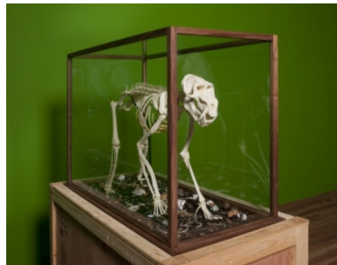
Mark Dion, Mandrillus Sphinx , 2012. Hout, glas, plastic, teer, metal, keramiek, papier, kurk en touw. Particuliere collectie, Parijs.

Dions werk was in Nederland voor het laatst te zien in solotentoonstellingen in De Vleeshal in Middelburg (1995) en De Appel in Amsterdam (1997). The Macabre Treasury vormt daarmee de eerste museumsolo in vijftien jaar van Mark Dion in Nederland. Het is mede om deze reden dat de tentoonstelling in Het Domein het karakter heeft van een beknopt retrospectief, met een nadruk op werken van de laatste tien jaar. In 2010 verwierf Museum Het Domein al Dions sleutelwerk Costume Bureau (2006) voor de collectie hedendaagse kunst – een kostuumgalerij waarin de kunstenaar verschillende uitdossingen