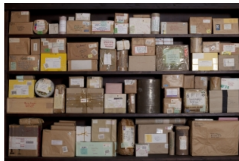
Mark Dion, The Gift , 1993 – 2000 (detail). Houten kast, pakketten, objecten. Grässlin collectie, St. Georgen.

Increasingly, my work has become macabre and laced with dusky pessimism. Early on I believed that ecological calamity could be averted by awareness. If people knew about issues like the loss of biodiversity or global warming, they would act so as to halt the problem. (...) Now, I just don't believe that it will all work out. Not that there will be a single great catastrophe, but rather the world will slowly become less biological diverse, more impoverished, an uglier, less remarkable place to live. (...)