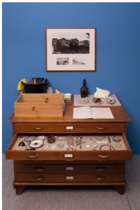
Mark Dion, History Trash Dig - Fribourg, 1995. Commode met 338 objecten, gereedschap, foto's. Particuliere collectie Keulen.

De Amerikaanse kunstenaar Mark Dion (New Bedford, Massachusetts, 1961) geldt internationaal als een van meest vooraanstaande kunstenaars van dit moment. Hij vervult een pioniersrol met zijn werk waarin ecologische vraagstukken en onze perceptie van de natuur centraal staan. Dion onderzoekt in zijn werk hoe dominante ideologieën en openbare instellingen als musea bepalen hoe wij ons een beeld vormen van de geschiedenis, hoe wij kennis vergaren en naar de natuur kijken. Door gebruik te maken van archeologische en andere wetenschappelijke methoden voor het verzamelen, ordenen en tentoonstellen van objecten creëert Dion werken die het onderscheid bevragen tussen 'objectieve' ('rationele') wetenschappelijke methoden en 'subjectieve' ('irrationele') invloeden. De vaak spectaculaire en fantasierijke curiositeitskabinetten die hij maakt, gebaseerd op zestiende-eeuwse rariteitenkamers, worden gekenmerkt door de atypische, afwijkende ordening van de objecten. Door te tonen hoezeer de publieke opinie en ons handelen op het gebied van natuur en milieu wortelen in de manier waarop onze kennis van de natuur wordt geconstrueerd, bevraagt de kunstenaar de autoriteit van de wetenschappelijke benadering binnen de hedendaagse maatschappij. Dion had solotentoonstellingen in onder meer de Tate Gallery in Londen (1999), het Museum of Modern Art in New York (2004), het Miami Art Museum (2006) en het Nouveau Musée National in Monaco (2011). Recentelijk nam hij deel aan dOCUMENTA (13) in Kassel.