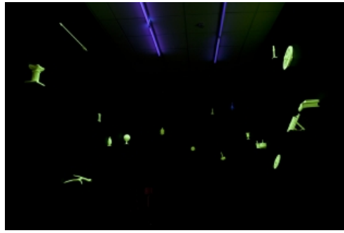
Mark Dion, Underworld Hall, 2013. Gevonden voorwerpen, fosforiserende verf, blacklights.

- Mark Dion, ongepubliceerd manuscript, 2001