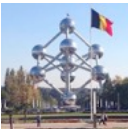
Atomium Brussel wereldtentoonstelling 1958 elementaire cel zuiver ijzer: natuurkundig 102 meter hoog