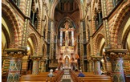
Basiliek Sittard 1879 katholiek kerkgebouw kruis basiliek