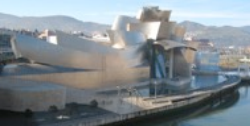
Frank Gehry 1997 Guggenheim museum Bilbao Spanje Het deconstructivisme is een eigentijdse stroming in de architectuur die ervan uitgaat dat de maatschappij verwarrend en onzeker is. Men probeert dat ook in haar bouwwerken tot uiting te laten komen. Ook vinden zij dat de functie de sfeer van het gebouw bepaalt.