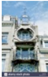
Jugendstil 1850 geïnspireerd op planten en natuur