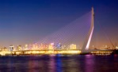
Erasmusbrug 1996 Rotterdam brug over de Nieuwe Maas Architect Ben van Berkel