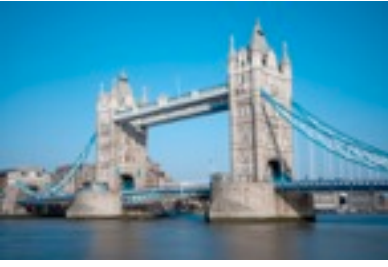
Tower bridge 1894 over rivier de Theems in Londen