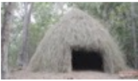
grashut bouwen https://www.youtube.com/watch?v=qEUGOyjewD4