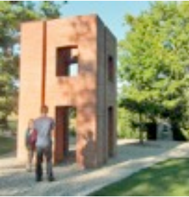
Per Kirkeby 1973 ontstond "Huset" (Huis), een eerste baksteensculptuur in een openbare ruimte